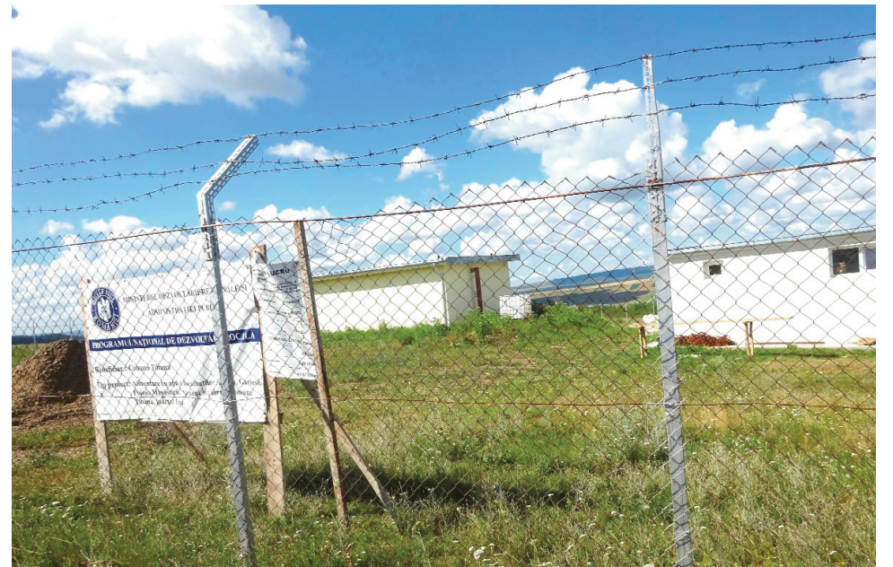
Stația de pompere

P: Da, majoritatea vin cu mașini. La noi condițiile s-au îmbunătățit. Avem asfalt până la Alexeni. Până la Oproaia s-a făcut anul trecut. La Gârbești am terminat tot anul trecut de pus stratul de uzură printr-o investiție de 5 milioane de lei. Mai avem o investiție tot la Gârbești pentru grădiniță de 1,5 milioane de lei, avem de reabilitat școala în viitor și tot în satul Gârbești avem de efectuat lucrări de reabilitare pentru rețeaua de apă potabilă. Deoarece nu a fost reabilitată în anii 2007-2008 am obținut un contract de dezvoltare de 8,2 milioane de euro. În acest an sperăm să montăm în satul Gârbești o stație de repompere.