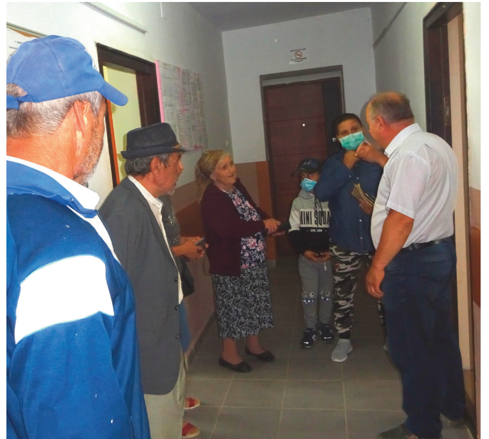
Primarul Gheorghe ROTARU stând de vorbă cu cetățenii pentru a nu lăsa nici o problemă nerezolvată

R: Dumneavoastră vă gândiți la realizări imediate și durabile: „facem un lucru pentru „x” ani, un altul pentru „y” ani”. Aceste lucruri sunt proiectate cu durabilitate în timp. Cum credeți că se va răsfrânge acest mod de a gândi asupra progresului economic al localității?