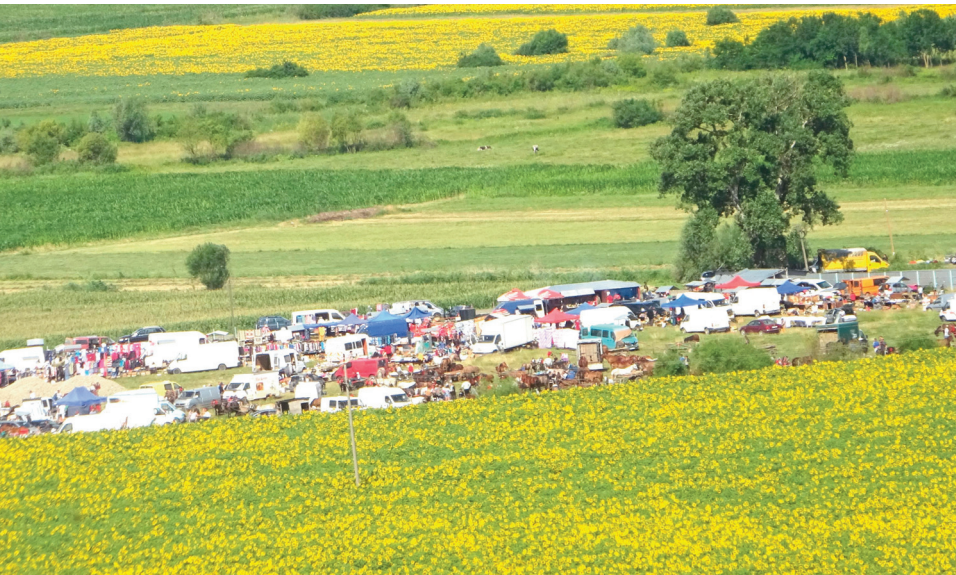
Târgul de la Țibana are o vechime de peste 100 de ani

P: Da, din cauza târgului care are o vechime de 100 și ceva de ani.