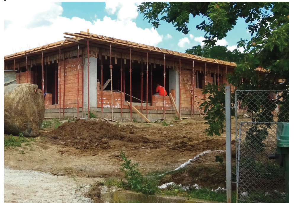
Continuă lucrările la Grădinița cu program normal pentru 5 grupe, sat Gârbești, com. Țibana, jud. Iași

P: Acolo am avut lucrări la grădiniță și la școala cu clasele V-VIII. La grădiniță s-a lucrat patru luni de zile, s-a turnat placa. Acum urmează să se pună acoperișul și mai sunt de făcut lucrări la finisajele interioare. La școală s-a decoperțat o parte de acoperiș. Se va pune tabla acoperișului, vom lucra la fațadă și vom preda lucrarea în așa fel încât la 1 septembrie să poată intra copiii în școală. Este singura școală modernă din comuna Țibana în acest moment. Mai sunt și celelalte școli din comună unde ar trebui să efectuăm lucrări. Nu avem grupuri sanitare la Alexei, Vadu Vejei, Domnița. Deocamdată ne-am făcut planificarea lucrărilor și proiectul tehnic. Cam atât. Sumele de care dispunem sunt mici.