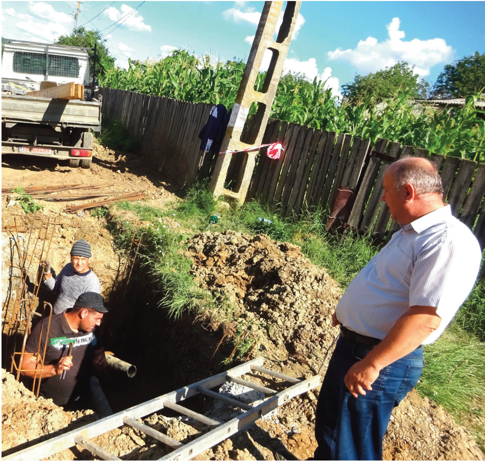
Se lucrează la rețeaua de apă

P: Acum se lucrează la rețeaua de apă. Aceste lucrări se execută pe străzile principale. Trei ani se vor derula aceste lucrări, până în 2022. În trei ani sperăm să dăm în folosință rețeaua de apă. De investiții se va ocupa firma Apa Vital, noi suntem parte dintr-un proiect la care participăm cu o cofinanțare de 50.000 de euro.