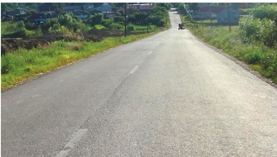
Asfalt spre Alexeni

R: Câți kilometri de drum ați mai asfaltat din primăvară și până acum? Ați făcut niște lucruri uimitoare din acest punct de vedere. Am văzut drumul din Alexeni și drumurile din alte sate.